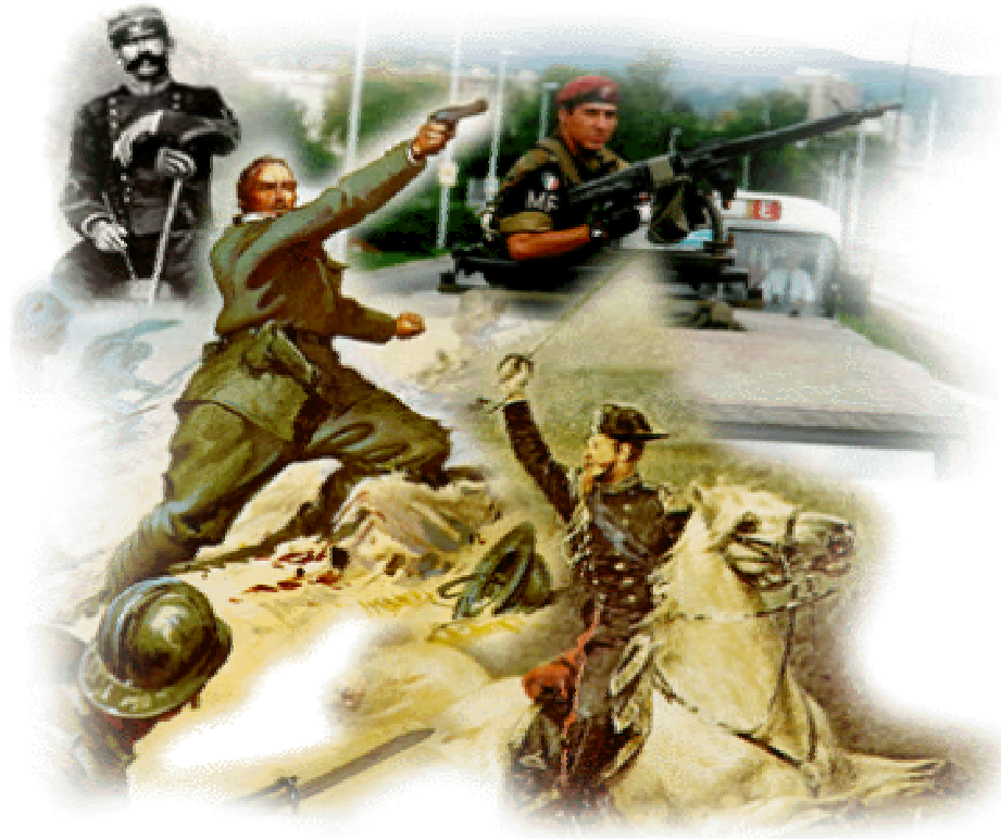
Soldati in guerra

Nella notte del 24 e 25 Luglio, il Gran Consiglio del fascismo, decise di deporre Mussolini.