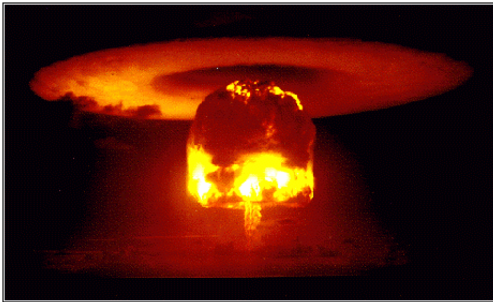
Esplosione a Hiroshima

L'Europa era ufficialmente uscita dal conflitto.