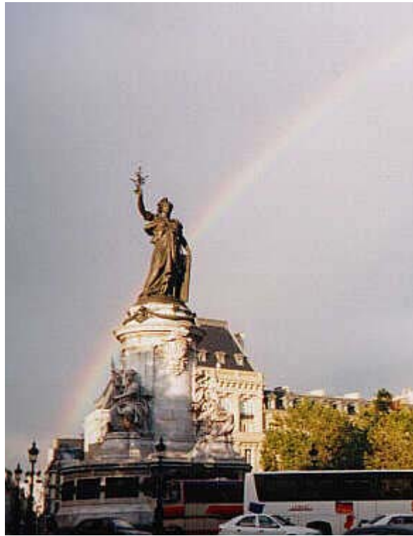
Place de la République

Sulla riva sinistra della Senna si trova il celebre quartiere degli intellettuali e degli artisti ( Quartiere Latino).