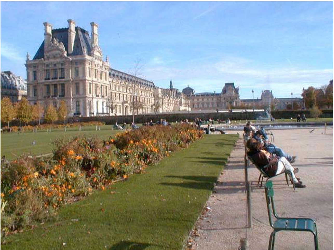
I giardini de la Tuileries con il palazzo del Louvre