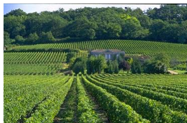
I famosi vigneti e vini di Bordeaux