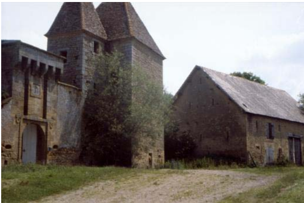
Casale di campagna francese

Si coltiva molto la vite, infatti molti vini famosi hanno preso nome da queste zone: Champagne, Bordeaux.