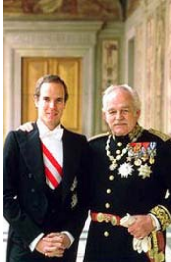
Il Principe di Monaco con il figlio