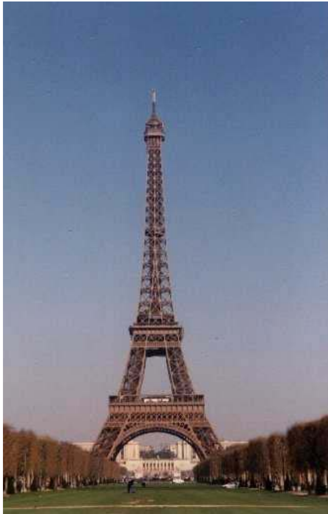
La torre Eiffel

Ci sono varie fonti di turismo: la torre Eiffel, la Corsica, la Costa Azzurra, Disneyland, ecc.