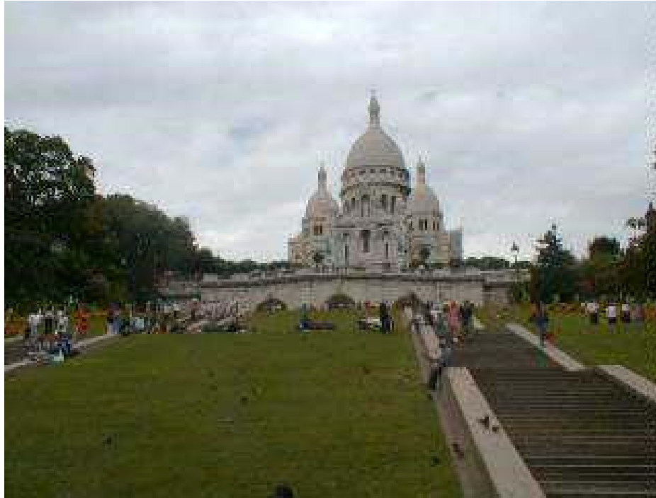
Montmartre, basilica del Sacre Coeur